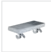
Ablageschale Bestell-Nr. 19274 – 19276