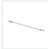
Sicherungsseil Bestell-Nr. 70738 – 70740