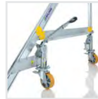
Fahrwerke Konfigurierbar / auf Anfrage