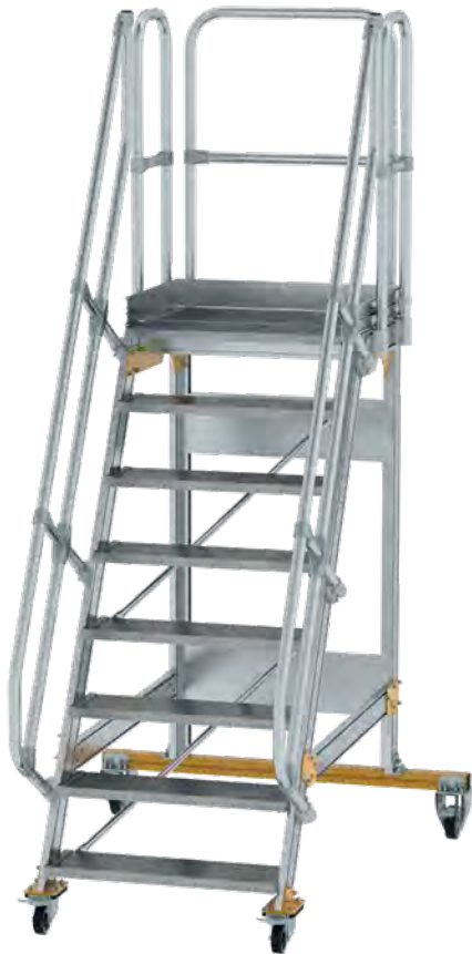
Abb. Bestell-Nr. 600728