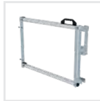
Sicherungs- schranke Bestell-Nr. 690746 – 690748